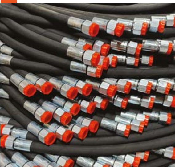
РУКАВА ВЫСОКОГО ДАВЛЕНИЯ